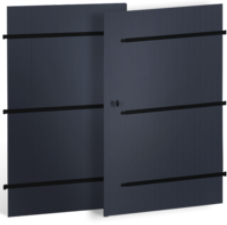
PORTES DE GARAGE 30mm à BARRES ET ÉCHARPES en ALUMINIUM