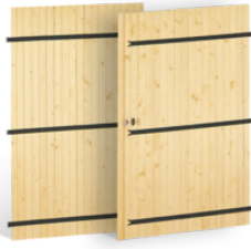
PORTES DE GARAGE 32mm à BARRES ET ÉCHARPES en BOIS