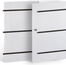
PORTES DE GARAGE 27mm à BARRES ET ÉCHARPES en PVC